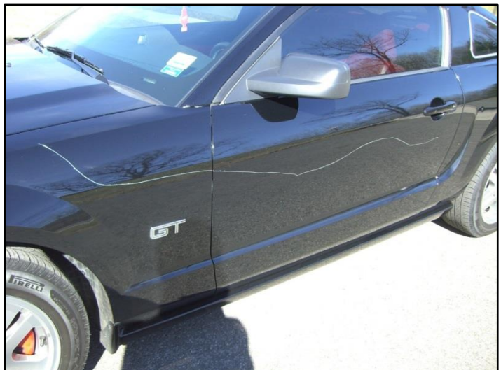
4. Raya tu carro con sus llaves