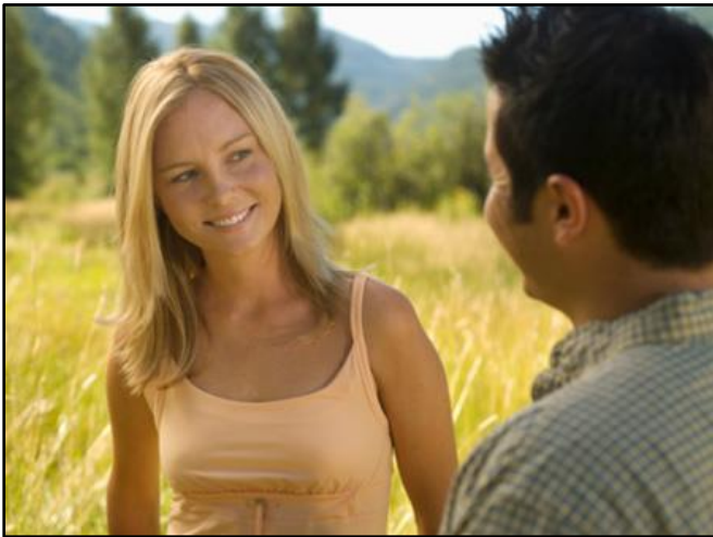
1. Te mira