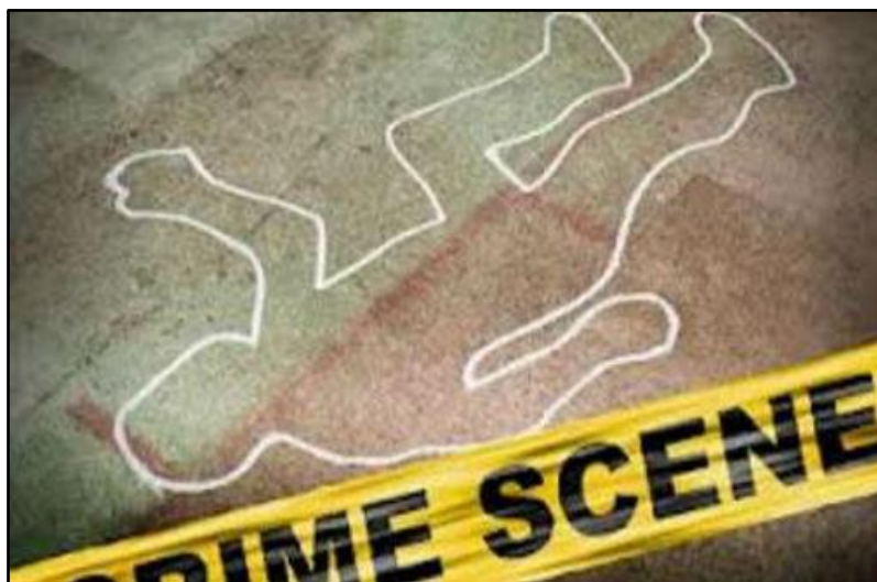
5. Te mata