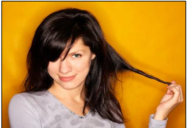
2. Toca su pelo